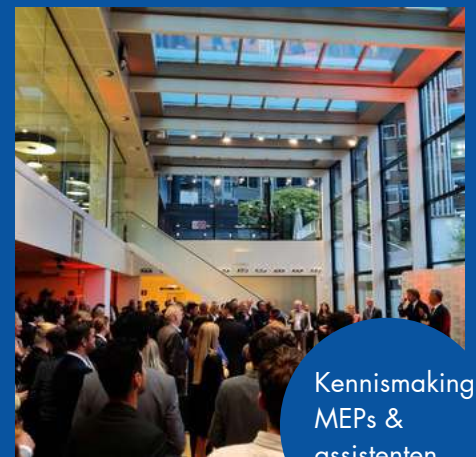
Kennismaking MEPs & assistenten