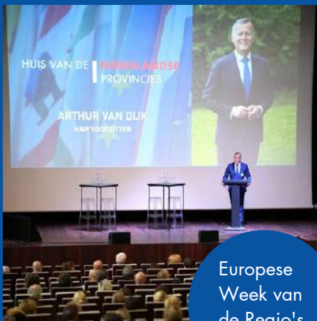
Europese Week van de Regio's en Steden

Op woensdag 9 oktober 2024 organiseerde het HNP als onderdeel van de Europese Week van Regio's en Steden (EWRC) een evenement voor 490 bestuurders, statenleden en ambtenaren uit de twaalf provincies. Het evenement had als doel de EU-kennis van provincies te vergroten, het Europese netwerk van de provincies te versterken en zichtbaarheid te creëren voor het werk van provincies in de EU. De bijeenkomst vond plaats in het Koninklijk Museum voor Schone Kunsten in Brussel.