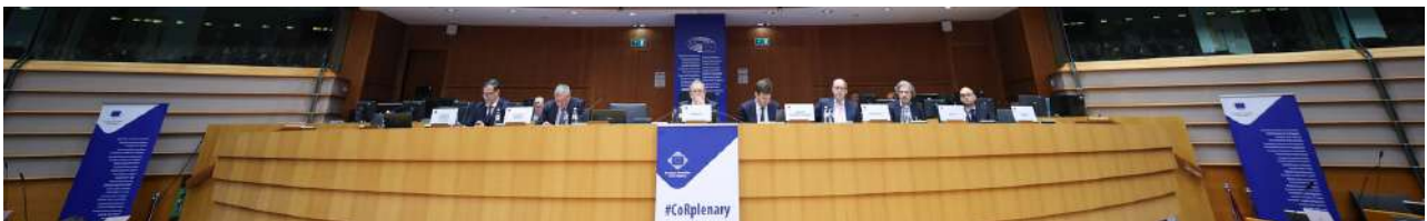
163rd Plenary Session of the European Committee of the Regions, Belgium - Brussels - November 2024

Het Europees Comité van de Regio's is het adviesorgaan waar lokale en regionale overheden hun stem laten horen in het besluitvormingsproces van de EU. De Europese Commissie, het Europees Parlement en de Raad raadplegen het Comité over nieuwe voorstellen op terreinen die raken aan lokaal en regionaal beleid. Zo bereidt het Comité adviezen voor op het gebied van milieu, economische en sociale cohesie, grensoverschrijdende samenwerking, (trans-Europees) transport, volksgezondheid, onderwijs en cultuur, werkgelegenheid en sociaal beleid. Daarnaast brengt het Comité op eigen initiatief adviezen uitbrengen. Het Comité bestaat uit 329 lokale en regionale vertegenwoordigers, die voor een periode van vijf jaar worden benoemd door de Raad.